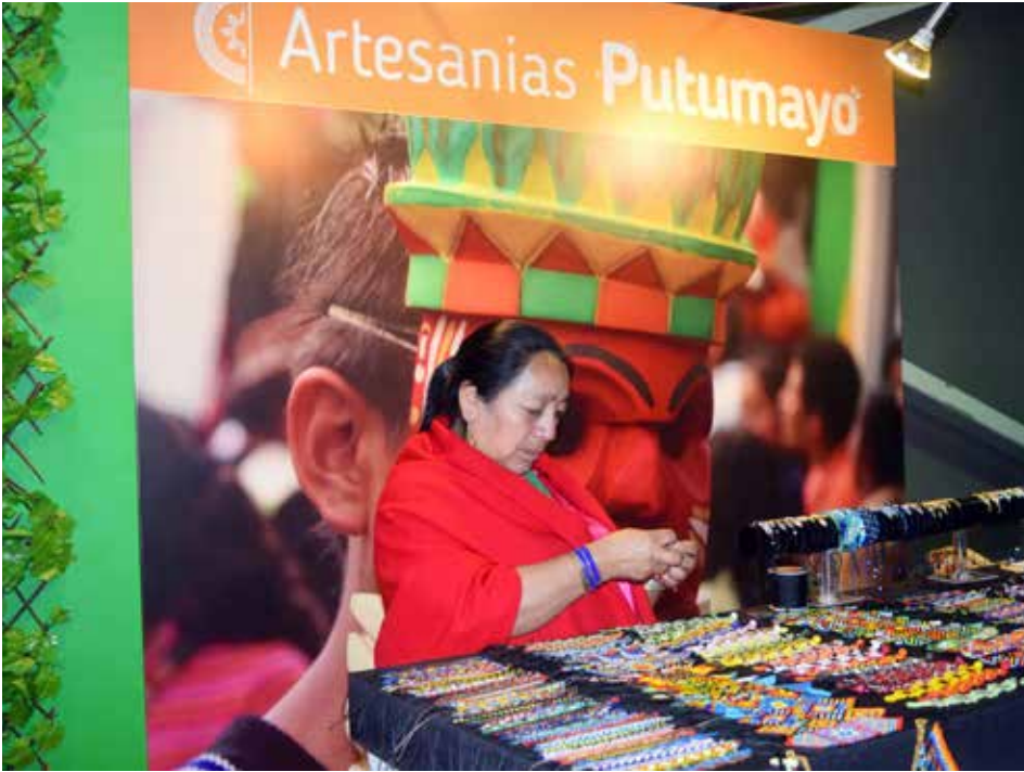
Artesana del Putumayo

Sxxi.net Durante tres días Corferias se vistió de riqueza ancestral, cultural y ambiental en la Semana del Putumayo.