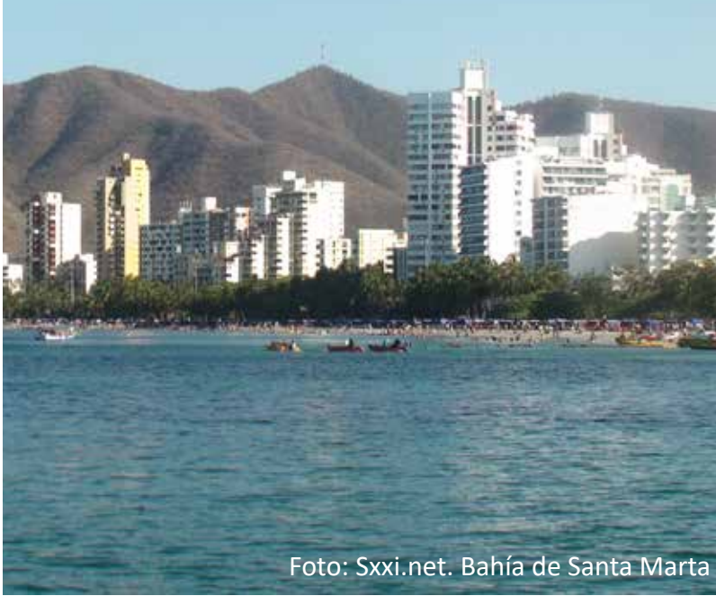
Bahía de Santa Marta