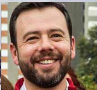
Carlos F. Galán

Uno de los temas más sensibles que definirá la vida de los bogotanos en la próxima vigencia es el ambiental, y es que la coyuntura que tiene la ciudad en materia de contaminación, de riesgo de pérdida de las fuentes de agua, y de espacios naturales, que son el pulmón de la Capital, permite asegurar, que estas elecciones van más allá de colores y partidos políticos, porque lo que está en juego es la vida de las personas, la salud, la educación y la protección de los recursos naturales para nuestro bienestar y el de generaciones futuras. En ese sentido, presentamos la propuesta ambiental de los candidatos a la Alcaldía de Bogotá, para que usted conscientemente vote por la persona más idónea, que no le haga el juego a la corrupción, y que defienda los intereses de los ciudadanos.