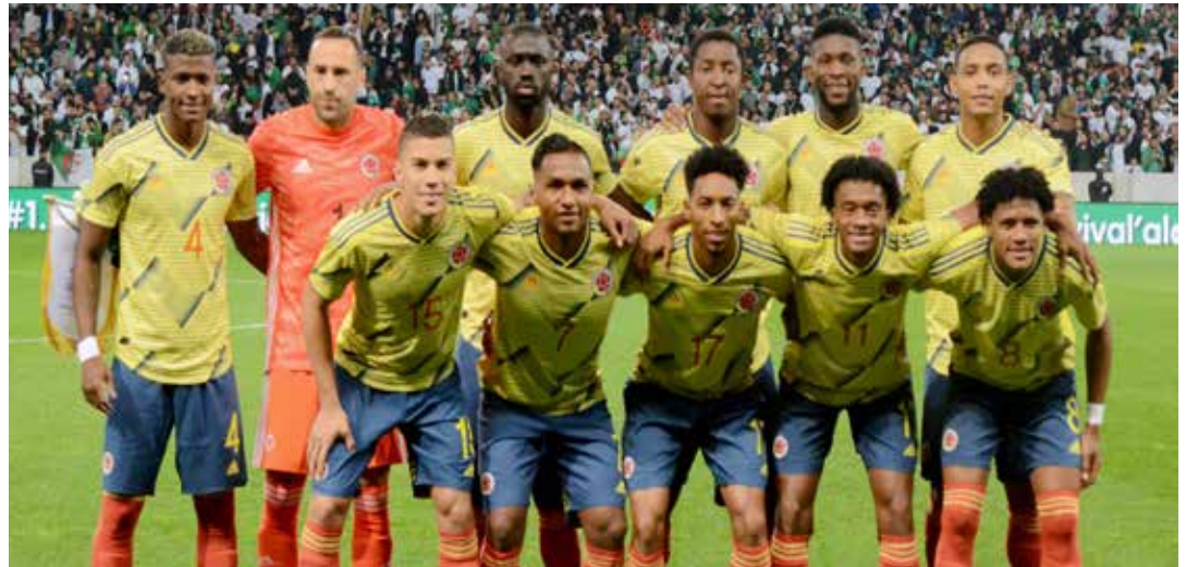
Selección Colombia de Fútbol.

Corresponsal desde Australia ssalazarceron@gmail.com