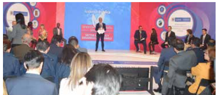
En las instalaciones de RTVC, y ante un selecto grupo de ambientalistas, el Ministro Ricardo Lozano presentó la Rendición de Cuentas del MADS.

De igual manera, en lo relacionado con la problemática de la deforestación, se resaltó la formalización de 366 acuerdos de conversación y restauración en los Parques Nacionales del país, 149 de restauración, 153 para frenar la deforestación y 64 para sistemas de producción