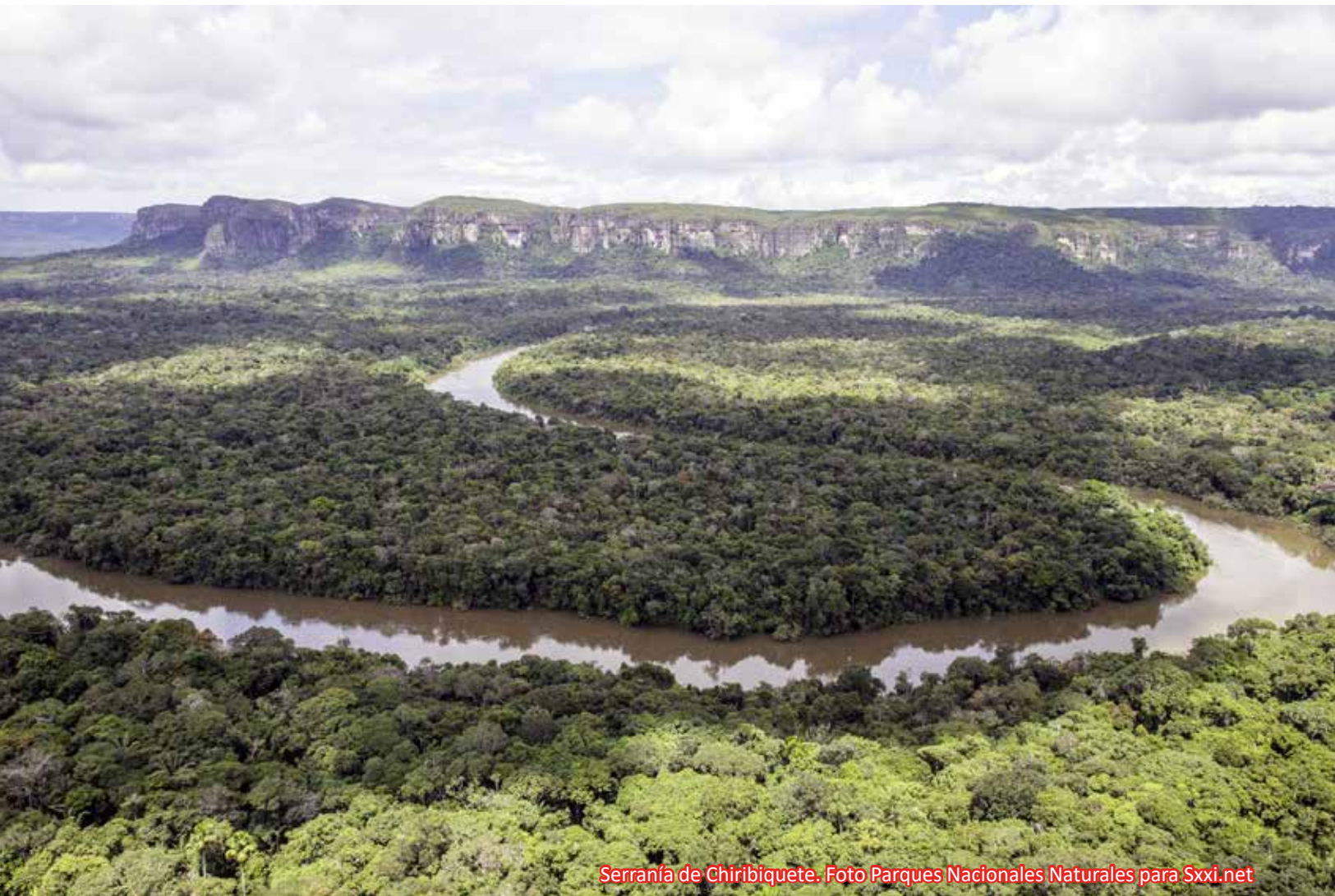
Serranía de Chiribiquete.

cuidado y protección, ejerciendo respetuosamente la labor que iniciaron los cuidadores ancestrales prácticamente extinguidos. Los colombianos: gobiernos de turno y sociedad civil, dueños de este bien que con esmero nos han heredado nuestros antepasados, debemos asumir el compromiso de preservar con responsabilidad el ecosistema estratégico que nos pertenece, protegiéndolo con políticas y acciones concretas de las amenazas que lo