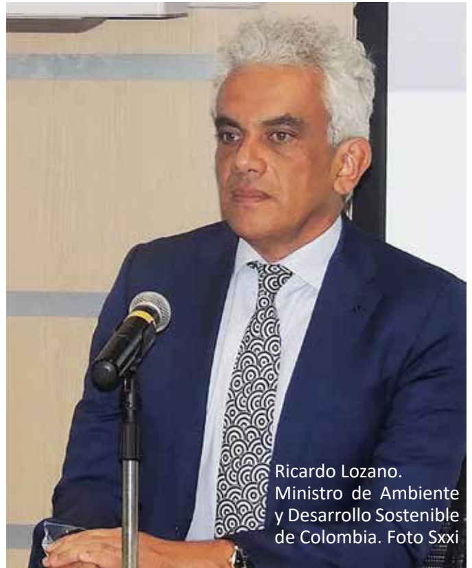
Ricardo Lozano. Ministro de Ambiente y Desarrollo Sostenible de Colombia.

sostenible en zonas aledañas; destacando que 2.183 familias se sumaron a los acuerdos de conservación de 86.074 hectáreas de bosque en los departamentos de Guaviare y Caquetá.