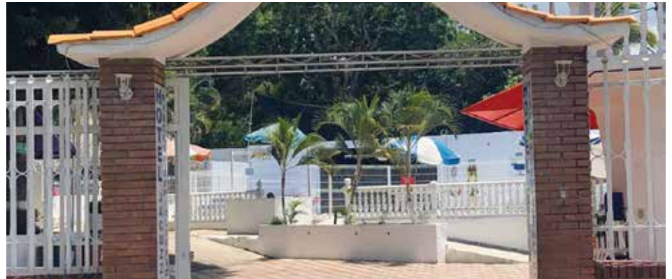
Melgar hotel de 1665 mts2. Produciendo. 18 habitaciones con baño cada una. áreas sociales, comedor. Local. Piscina semi-olímpica y para niños. Jacuzzi. 20 parqueaderos. Info. 3006029844