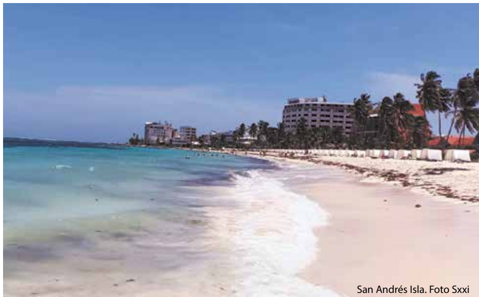
San Andrés Isla.

recipientes para depósito de residuos, recolección de escombros, implementación de la economía circular, limpieza de senderos y calles, ornato de espacios y una cálida y honrada atención a los visitantes sean nacionales o extranjeros, condiciones de las que carecen los territorios que visitamos en el país de la belleza, inundado de basura y gobernado por la desidia de habitantes y autoridades.