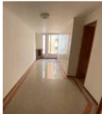
APTO. PASADENA $360-M