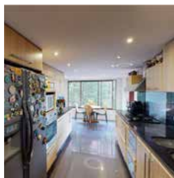
APTO EN CHICO ALTO $1.900-M