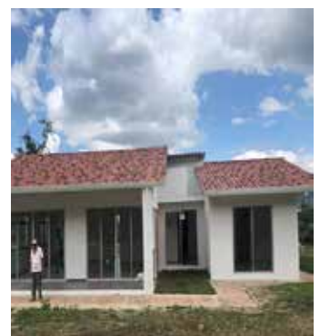
CASA PANDI $410-M