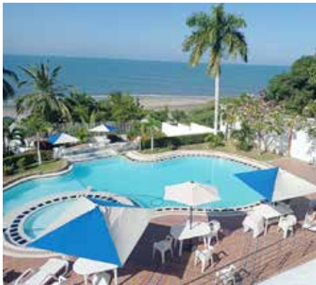
Apto. Santa Martha frente al mar 114mts 3H, 3B $590M Info. 3006029844