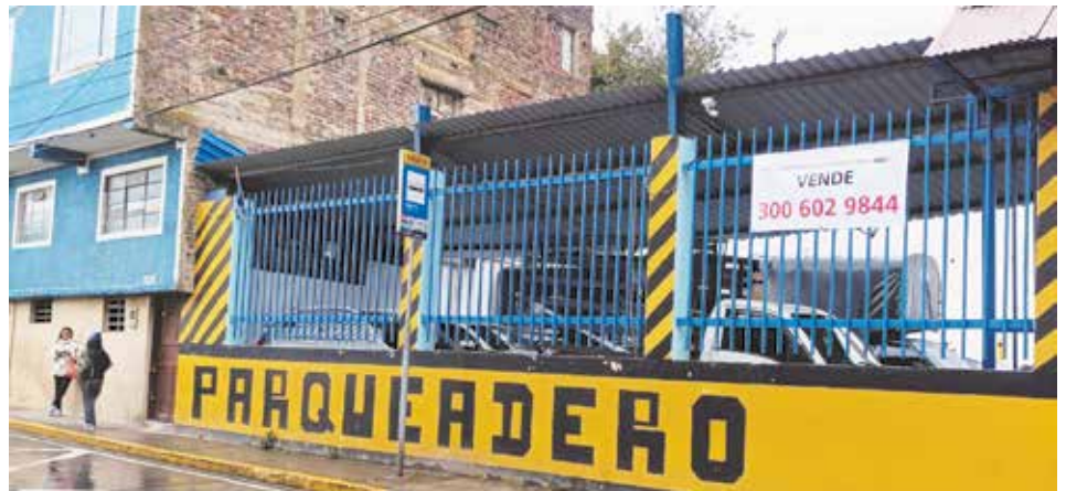
Bogotá Lote - Parqueadero y lavadero - Produciendo 265mts2 $600 M Info. 3006029844

Ahorra el 10% en compra llamando ya! 3006029844