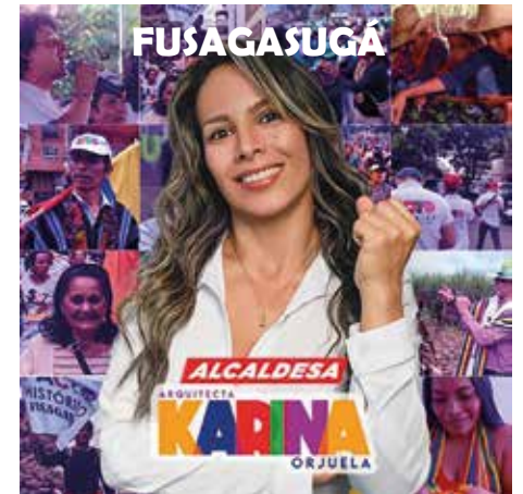
Publicidad política pagada

Los retos que enfrenta el programa Basura Cero son innumerables, pero concretarlo debe ser una misión de cada habitante de Colombia, pues la contribución de todos permitiría dar un paso gigante en el objetivo de la implementación y desarrollo de la economía circular; remunerar adecuadamente y favorecer una vida digna a quienes tienen como oficio el reciclaje, mejorar la calidad de vida, y sería fundamental en el propósito de aportar a disminuir el impacto del cambio climático.