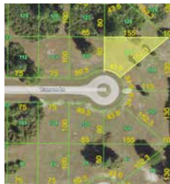
LOTE EN LA FLORIDA EEUU. $US 35.000