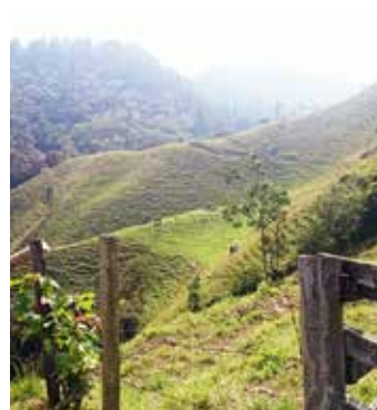
FINCA FRESNO $55-M HEC