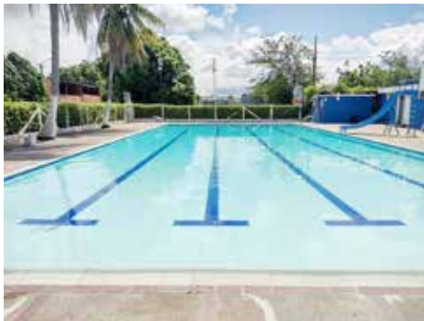
Apto. en Flandes Tolima 98mts 3H, 2B $140M Info. 3006029844